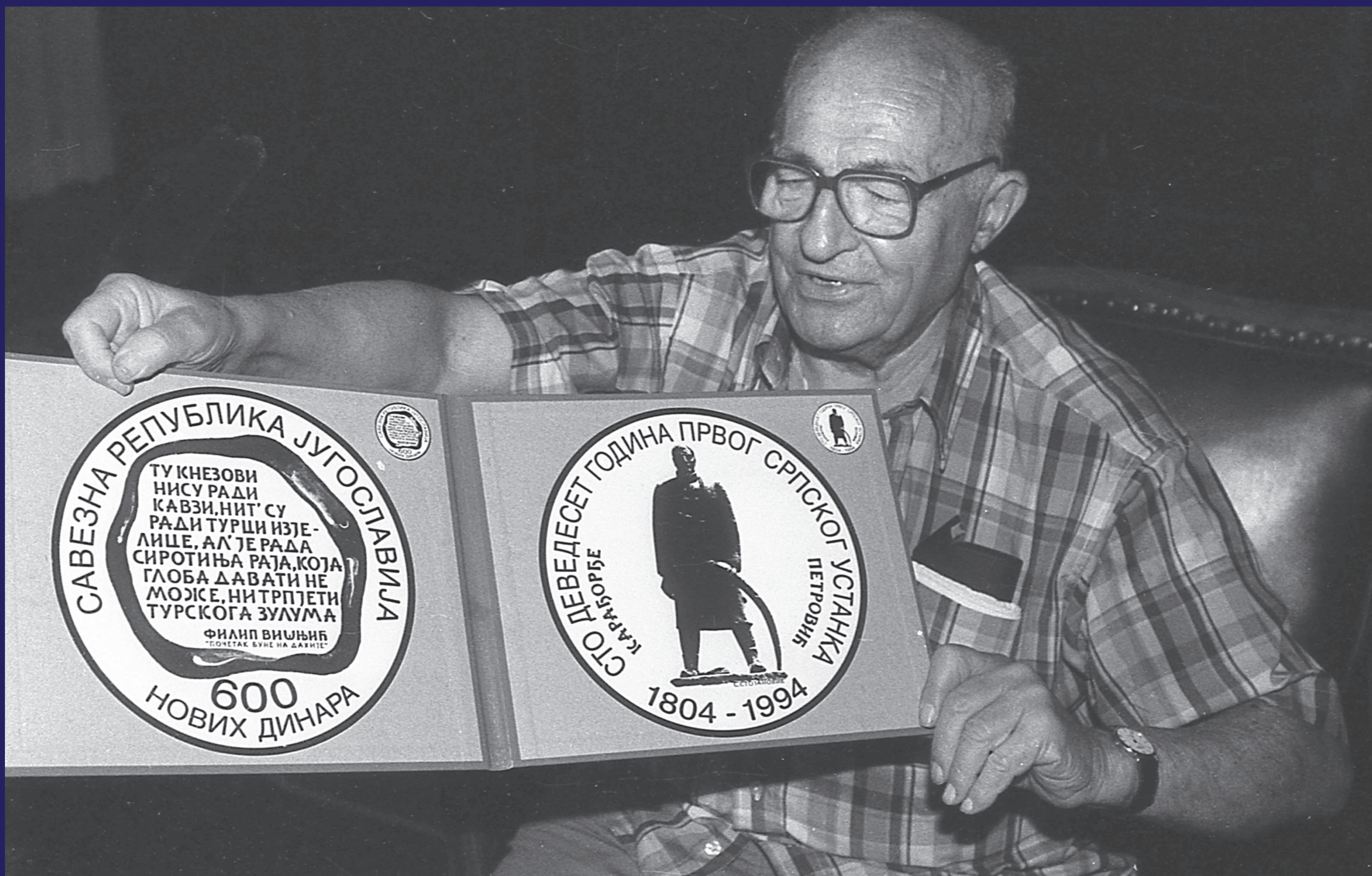
Драгослав Аврамовић, гувернер Народне банке Југославије, показује мустру пригодне кованице у износу од шест стотина динара издате поводом 190-годишњице Првог српског устанка, Београд, август 1994.